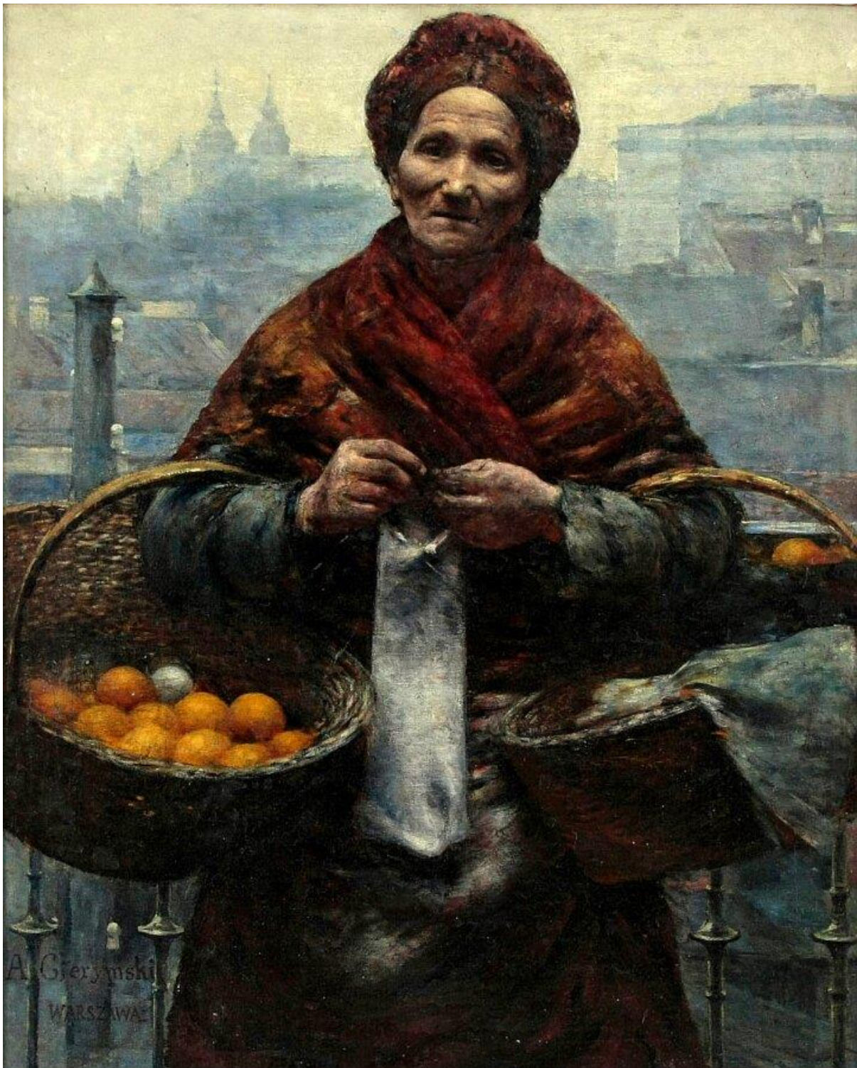
Aleksander Gierzyński, Żydówka z pomarańczami , olej na płótnie, Muzeum Narodowe w Warszawie

Temat: Hamlet XIX wieku, czyli bezdomność z wyboru.