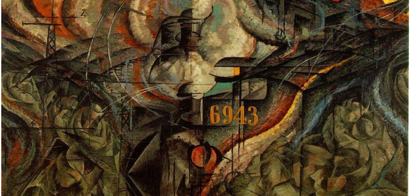
Umberto Boccioni, Stany umysłu II: Pożegnania (fragment), 1911

Dynamiczny rozwój nauki i techniki w pierwszych dekadach XX wieku, postępująca urbanizacja i industrializacja, kryzys I wojny światowej i spowodowana przezeń przebudowa politycznego porządku świata, wreszcie towarzyszące tym zjawiskom procesy przemian społecznych z jednej strony motywowały diagnozy kryzysu kultury, natomiast z drugiej – pobudzały do projektowania nowego człowieka i nowej organizacji ludzkiej zbiorowości. Niektóre z tych projektów, wysuwające na plan pierwszy hasła społecznej i politycznej rewolucji (bolszewizm, faszyzm), dramatycznie i na wielką skalę wstrząsnęły Europą. Równoległe do nich, a niekiedy - w związku z nimi pojawiły się również takie, które właściwe im wizje człowieka i społeczeństwa urzeczywistniać próbowały nieco innymi środkami. Postulaty odnowy kultury wiązały one ściśle z nową estetyką i wiarą w siłę oddziaływania sztuki na jednostkę i społeczeństwo. To charakterystyczny rys tamtego czasu: autentyczne przekonanie, że teoria i praktyka w sferze estetycznej mogą stać się narzędziem, które trwale i na wielką skalę zmieni właściwe