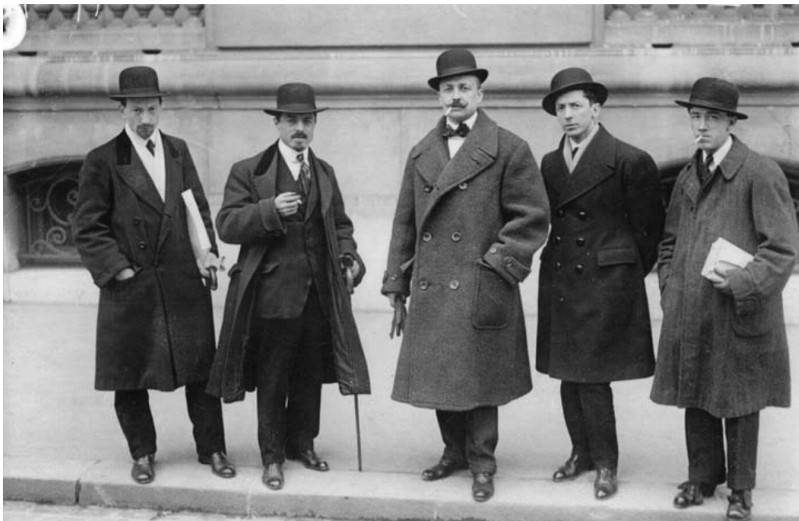
Portret futurystów włoskich

Futuryzm, nim dotarł do Polski, rozwijał się dynamicznie we Włoszech i w Rosji. Manifest włoskiego futuryzmu ogłoszony został przez czołowego reprezentanta tego ruchu, - Filippo Tomaso Marinetti - w 1909 roku oraz Antonio Sant'Elia .