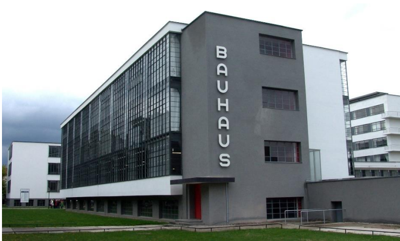
Druga siedziba Bauhausu w Dessau Walter Gropius, 1925–1926, licencja: CC BY-SA 3.0