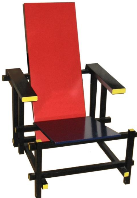
Gerrit Rietveld, Red blue chair , 1923 (według projektu z 1917 roku), licencja: CC BY-SA 3.0