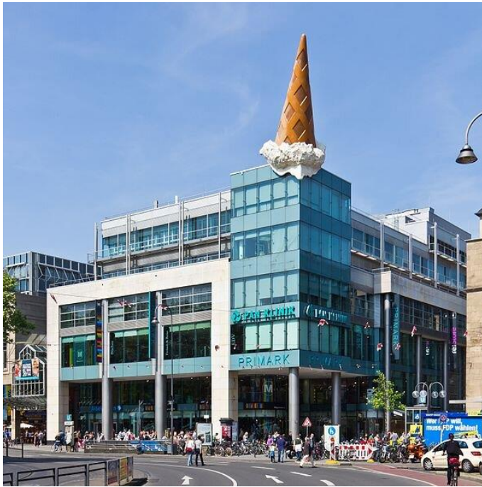
Claes Oldenburg i Coosje van Bruggen, Dropped Cone , 2001, stal galwanizowana, plastik, ok. 12 x 6 m, Neumarkt-Galerie, Kolonia