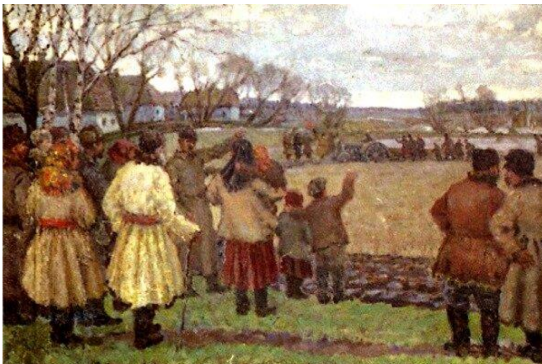
Wladimir Krikhatzkij, Pierwszy traktor , licencja: CC 0