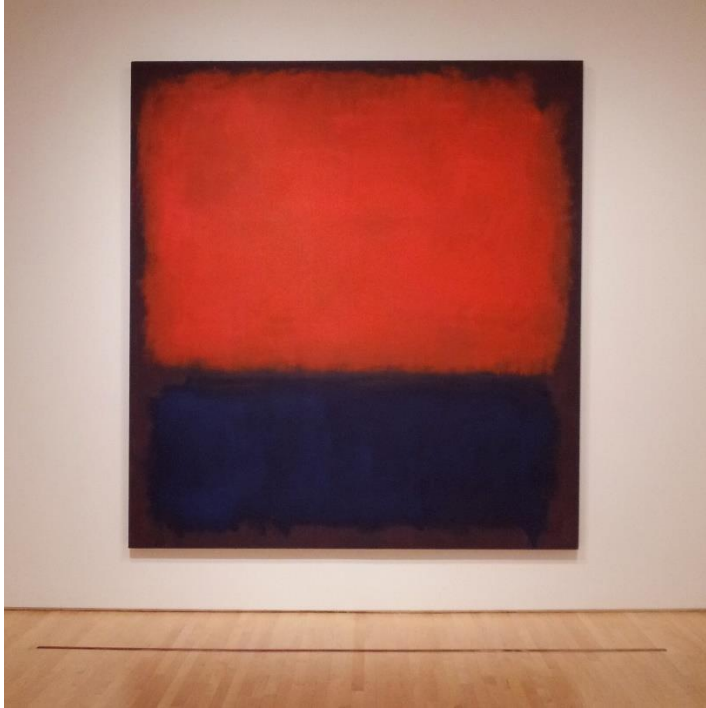
Mark Rothko, Number 14 , 1960, olej na płótnie, Museum of Modern Art, San Francisco, 291 x 268 cm, licencja: CC 0

sztuka głównie europejska lub północnoamerykańska, rozwijająca się w wielkich ośrodkach miejskich, elitarnych uczelniach artystycznych, eksponowana w nowoczesnych galeriach i uprawiana w przeważającej części przez mężczyzn.