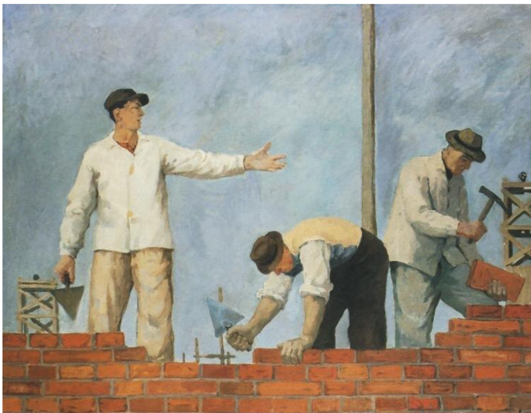
Aleksander Kobzej, Podaj cegłę , 1950, Muzeum Narodowe we Wrocławiu, licencja: CC 0