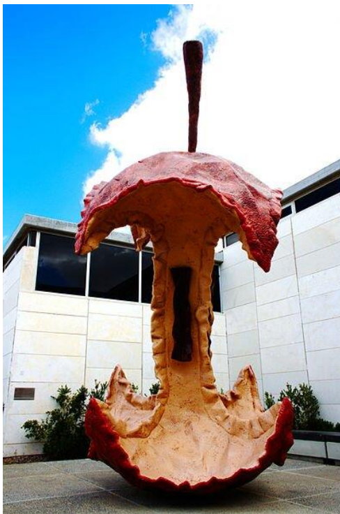
Claes Oldenburg, Coosje van Bruggen, Apple Core , 1992, stal nierdzewna, piana uretanu, żywica, Israel Museum, Jerozolima