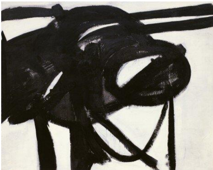
Franz Kline, Chief , 1950, olej na płótnie, Museum of Modern Art, Nowy Jork,