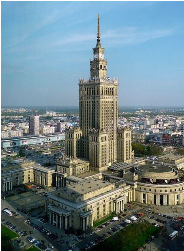
Pałac Kultury i Nauki w Warszawie

Pałac Kultury i Nauki w Warszawie (il. poniżej), noszący dawniej imię Józefa Stalina, został oddany do użytku 21 lipca 1955 roku - w przeddzień Święta Odrodzenia Polski (ówczesnego odpowiednika Święta Niepodległości). Budynek łączył wszystkie najgorsze cechy architektury socrealistycznej, a ponadto okazał się нефunkcjonalny. Jego oświetlenie wymagało ogromnych nakładów energii elektrycznej.