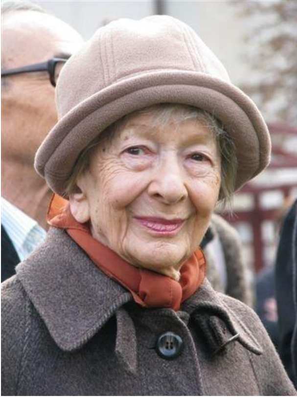
Mariusz Kubik, licencja: CC BY 3.0