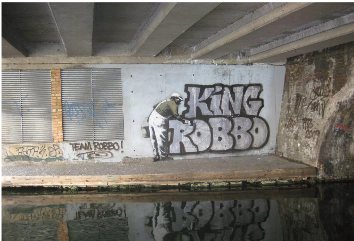
Matt Brown, Graffiti, licencja: CC BY 2.0