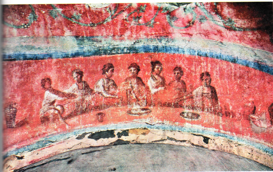
Agapa, malowidło z katakumb rzymskich, II w.

Od 260 r. chrześcijanie cieszyli się względną tolerancją religijną, mogli zakładać kościoły, cmentarze i mieć majątek. Ostatnia fala prześladowań spadła na nich w początkach IV w. z inspiracji cesarza Dioklecjana. Nakazał on składanie publicznie ofiar bogom, najpierw przez żołnierzy, a potem przez członków dworu cesarskiego.