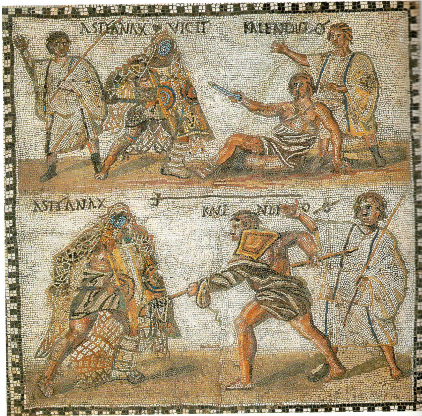
Gladiatorzy, mozaika rzymska z IV w., Narodowe Muzeum Archeologiczne w Madrycie

1. Przeanalizuj ilustrację, a następnie wyjaśnij, czym się trudnili gladiatorzy.