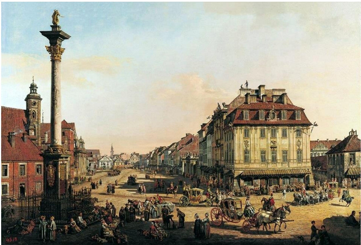
Bernardo Belotto (zwany: Canaletto), Krakowskie Przedmieście od strony Bramy Krakowskiej , 1767–1768, olej na płótnie, Zamek Królewski w Warszawie