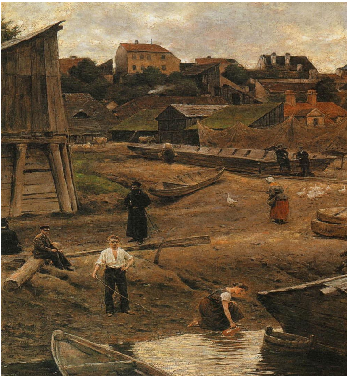
Aleksander Gierzyński, Powiśle , 1883, olej na płótnie, Muzeum Narodowe w Krakowie

Wyszukaj w Lalce fragmenty, w których został ukazany Paryż, i omów sposób ukazania stolicy Francji. Wyjaśnij, dlaczego Stanisław Wokulski jest zachwycony tym miastem.