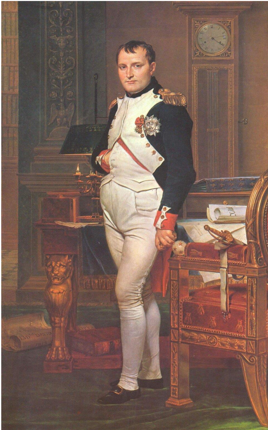
Jacques-Louis David, Napoleon w swoim gabinecie w Tuileries , 1812, olej na płótnie, National Gallery of Art, Washington