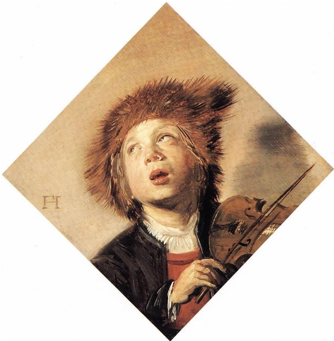
Frans Hals, Chłopiec grający na skrzypcach , ok. 1625, olej na desce, kolekcja prywatna

Przeczytaj nowelę Henryka Sienkiewicza pt. Janko Muzykant .