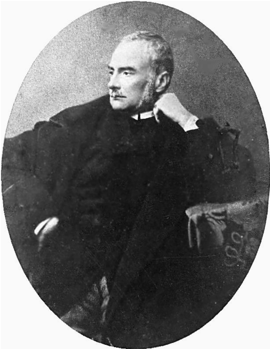
polona, Zygmunt Krasicki