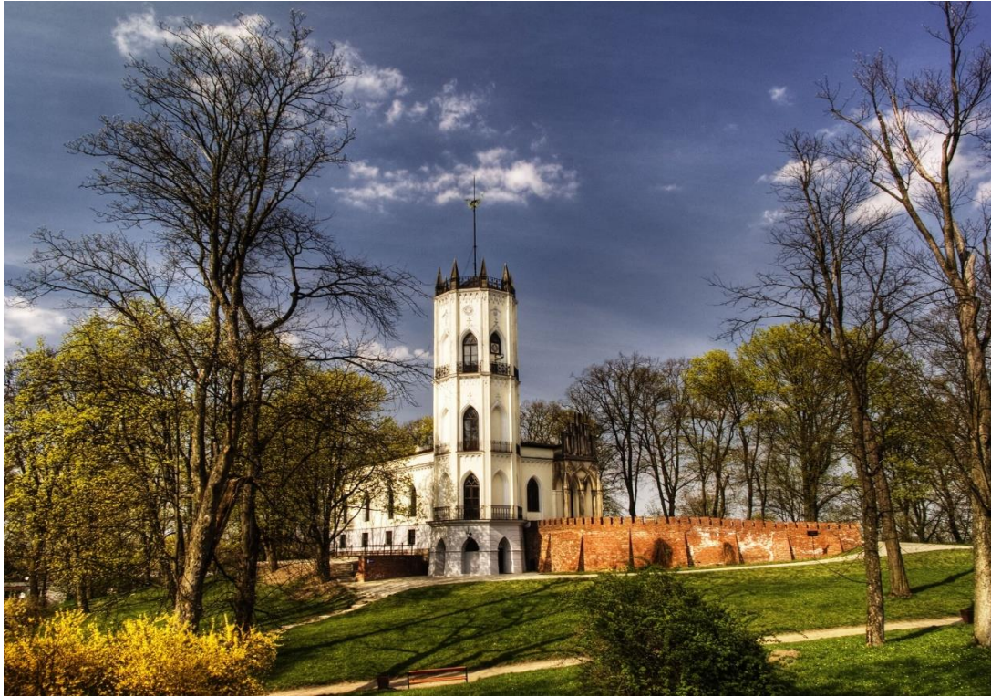
Semu, Neogotycki pałac Krasieńskich w Opinogórze Górnej, licencja: CC BY-SA 4.0