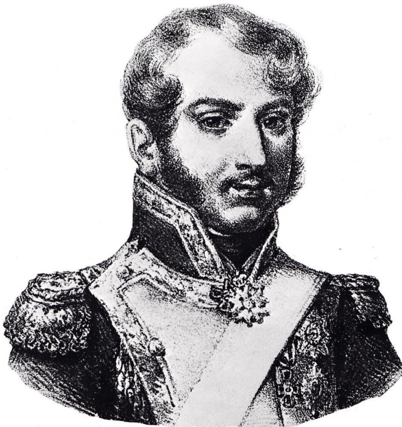
Wincenty Krasieński, ojciec poety, licencja: CC 0