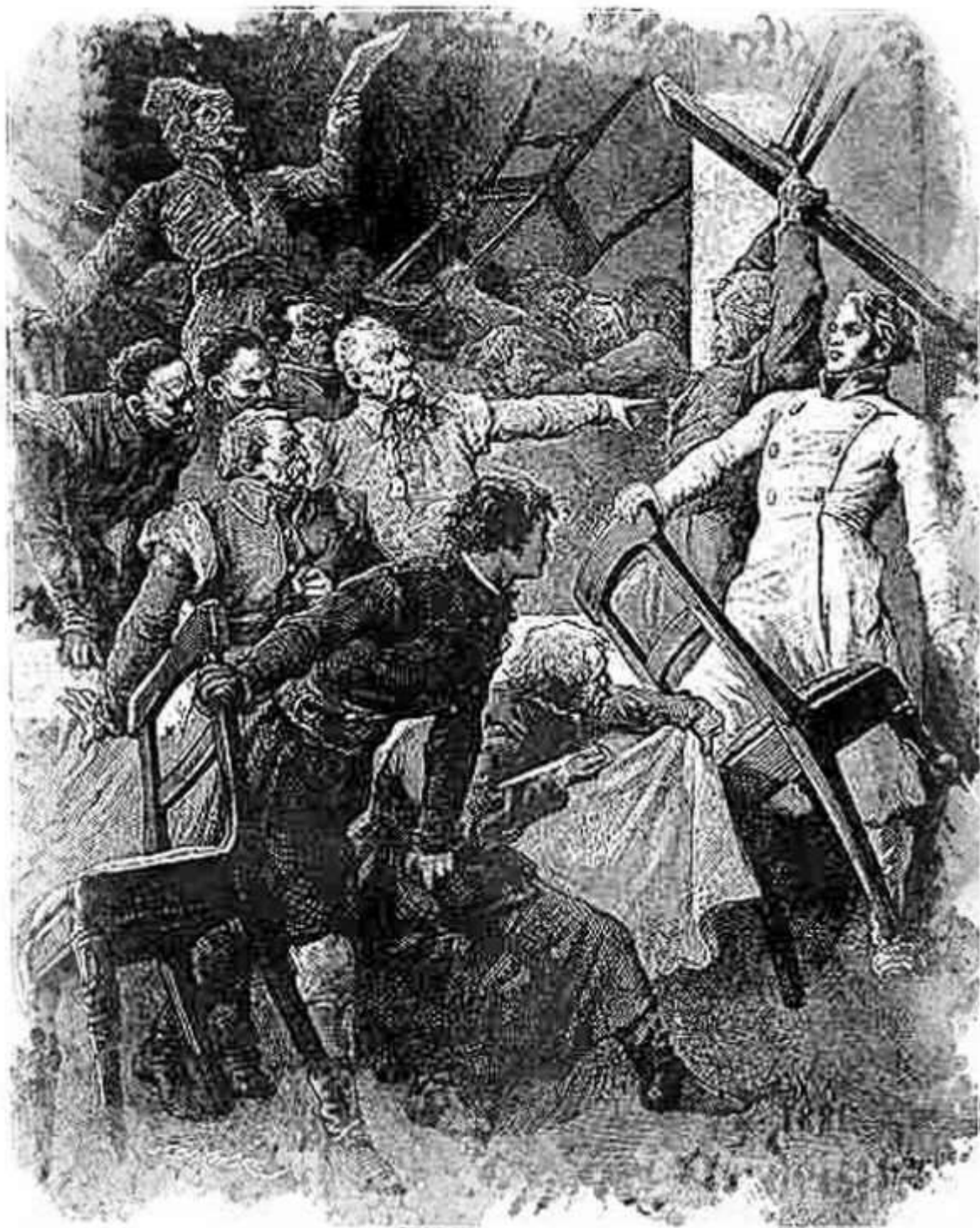
Ilustracja do Pana Tadeusza Michał Elwiro Andriolli, Kłótnia , 1881

Poemat Mickiewicza na samym początku nie odniósł sukcesu wydawniczego. Krytycy literaccy różnie i niejednoznacznie odnosili się do tego utworu. Rozczarowanie poczuli również czytelnicy. Brakowało im w poemacie typowych wyznaczników literatury romantycznej: irracjonalizmu, fantastyki, bohatera bajronicznego, nieszczęśliwej miłości,