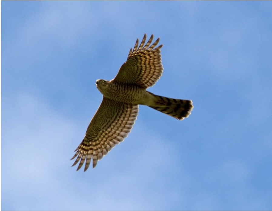
Krogulec