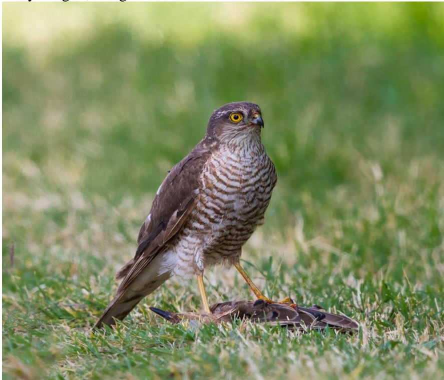
Krogulec na ziemi, Pierre Dalous, Sparrowhawk with its prey