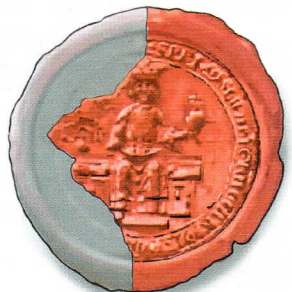
Trzy pieczęcie księcia Przemysła I (odrysy i odcisk) Przemysł I (ok. 1220–1257) był księciem Wielkopolski, synem Władysława Odonica i ojcem późniejszego króla Przemysła II.