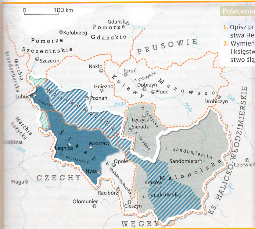
Państwo pierwszych Henryków śląskich