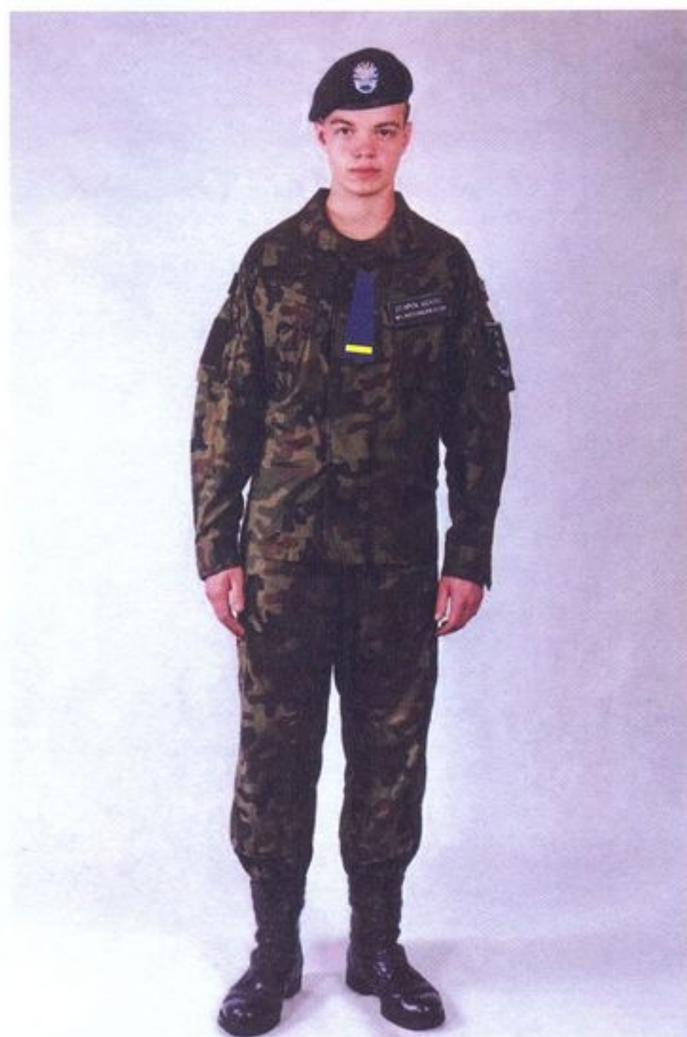
Rys. 13. Kadet w umundurowaniu polowym wz. 2010.