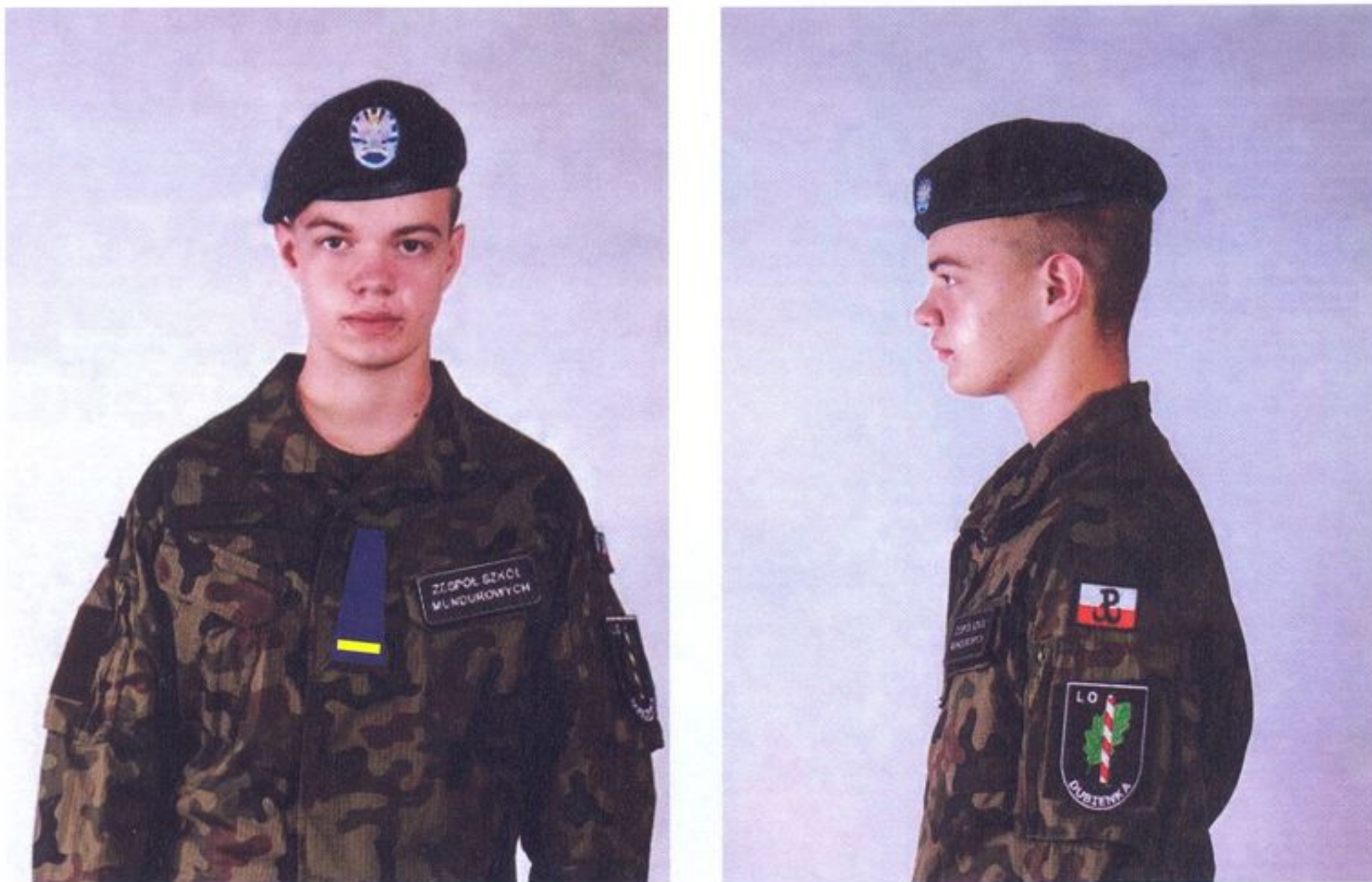
Rys. 12. Nakrycie głowy (beret) kadeta oraz przykładowy sposób noszenia oznak na bluzie munduru polowego wz. 2010.